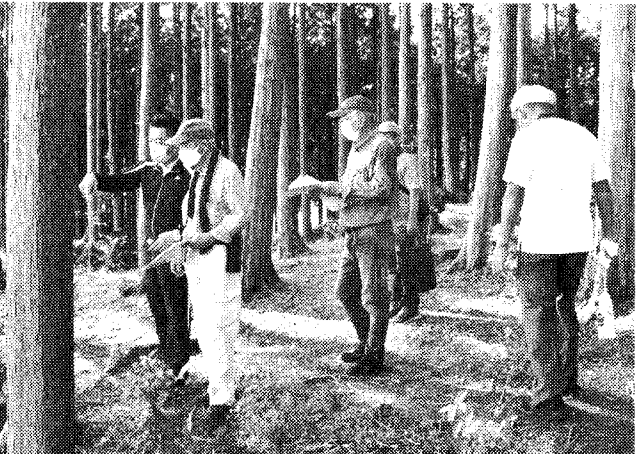
整備されたヒノキ人工林内を歩きながら、これまでの活動について説明が行われた

林は、間伐によって陽の光が差し込むようになった。整備された遊歩道は歩きやすく、鳥の音が聞こえ、眺めの良い場所からは沼津を一望することができる。